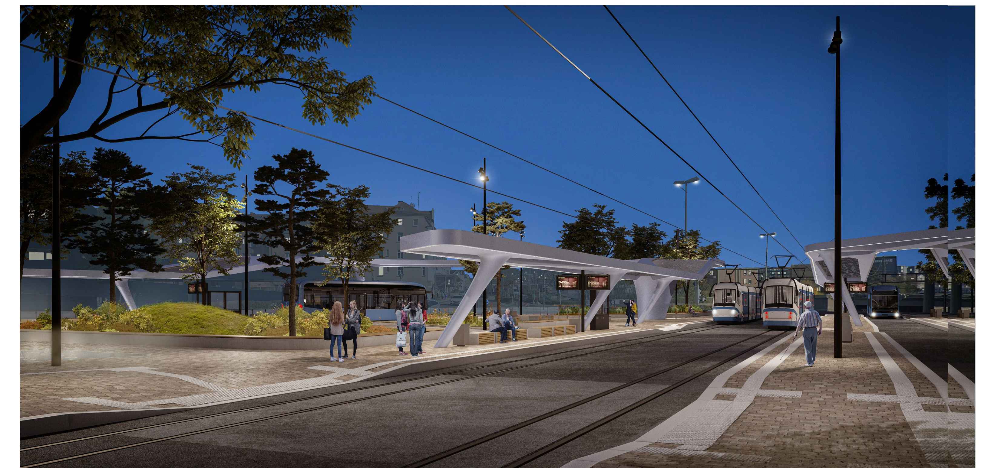
Perspektive von Westen bei Dämmerung