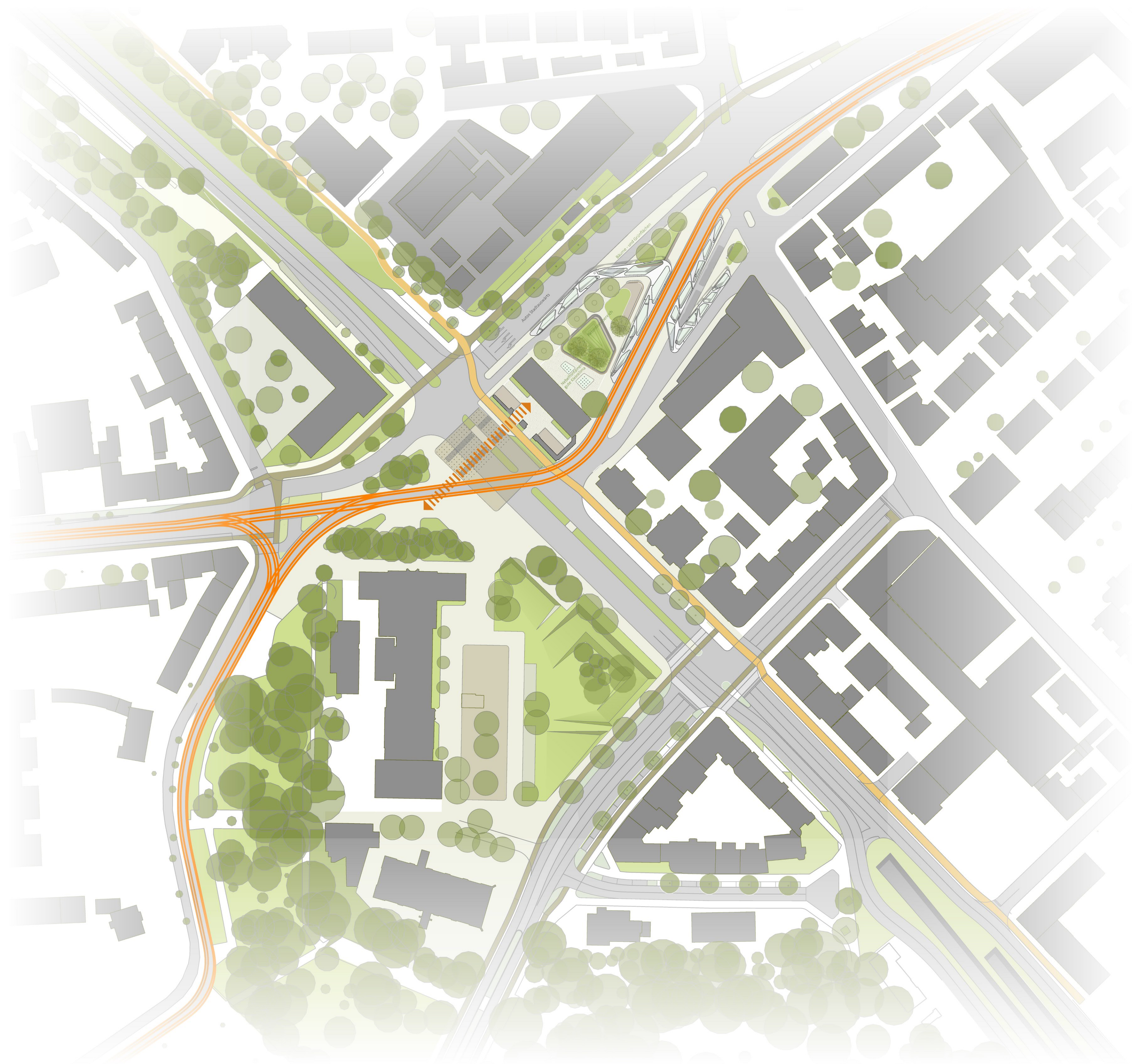
Lageplan 1 | 1000

Bewerbergemeinschaft: tr gmbh | Kap_6 Architektur & Design | Planstatt Senner GmbH.