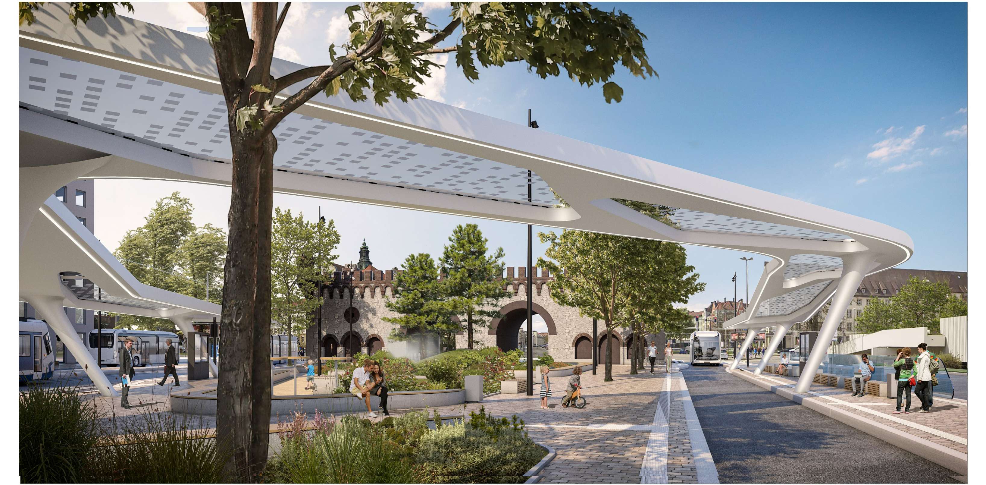
Perspektive vom Platz Richtung Einger Tor