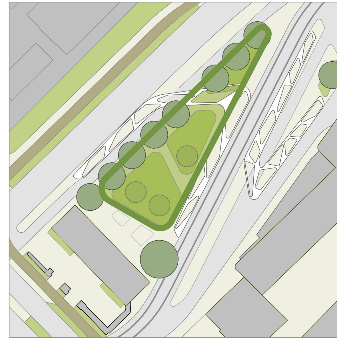
Picto 1 | Grüne Oase in der Stadt

darunter ein Dach als ein "HAUCH VON NICHTS"